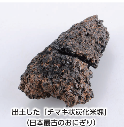
出土した「チマキ状炭化米塊」 (日本最古のおにぎり)