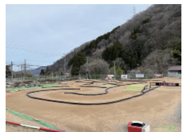
サーキットコース

天候の影響で屋外でのラジコン走行が難しくなる冬の場の売上減少を補う対策として、バードハミング鳥越内にあり、十年以上使用していないプールエリアをレース場として活用することを提案しました。