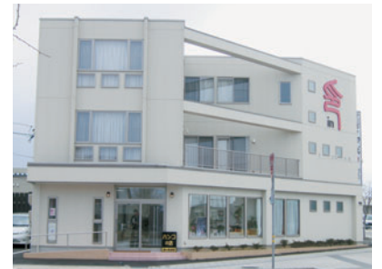
真っ白の3階建の壁面に篆書体で「印」の文字が印象的な新店