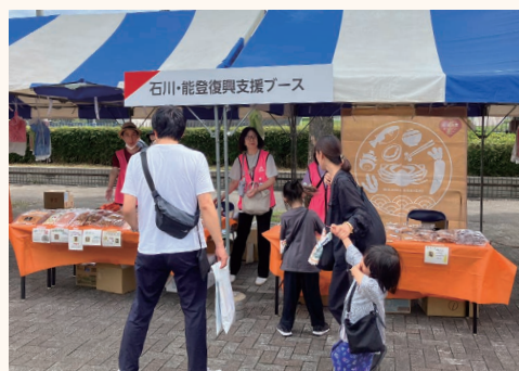
東京で開催されたトラックイベントに能登復興支援ブースを出展。輪島の特産品を販売し、支援の輪を広げました。

2024年の能登半島地震では、発災直後に現地入りして被災地支援を行いました。有志として多くの社員が手を挙げ、幾度も能登に通って物資輸送や炊き出しなどを実施。同年の豪雨災害においても、片付けや泥出しなどに多くの社員が汗を流しました。またグループ4社から「輪島朝市を応援する会」へ車両を寄贈するなど、出張輪島朝市の活動もサポートしています。今後も継続的なボランティア活動を通じて、能登の復興を応援してまいります。