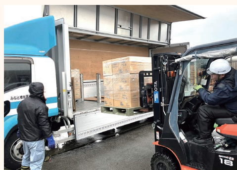
県トラック協会の活動として被災地への物資輸送を実施。道路状況が悪い中、水や食品、衛生用品などを被災地に届けました。