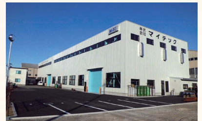
白山市湊町にあるマイテックの社屋外観。安全確保と品質向上をモットーに日々、高品質・クイックデリバリー・コストダウンが追求されています。