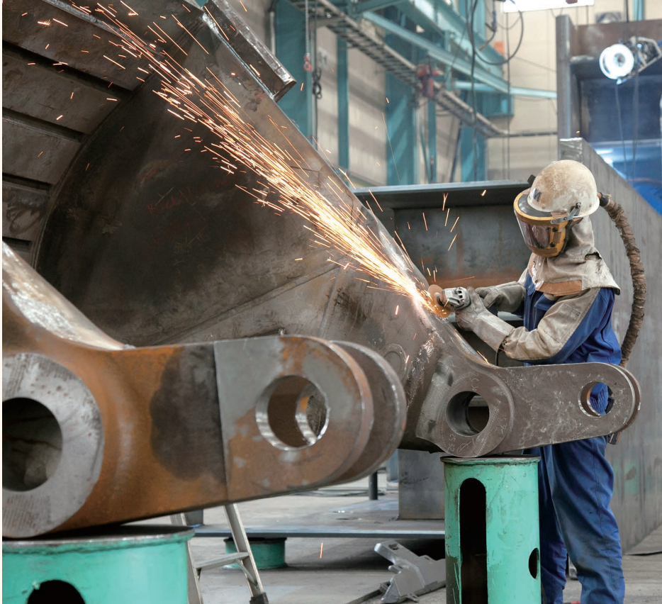
最高30tの大型製品も扱える技術力が自慢。完成したときの達成感はひとしお。