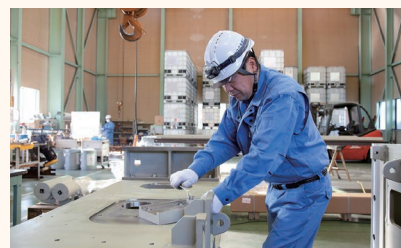
「機械を動かすのは“人”。素材の特性や加工工程での熱変形なども考慮し、機械の性能を超える高い精度を出すのが弊社の社員です」と二木社長。経験や工夫を重ね、技術を磨きながら部品製作から組立まで一貫して行っています。