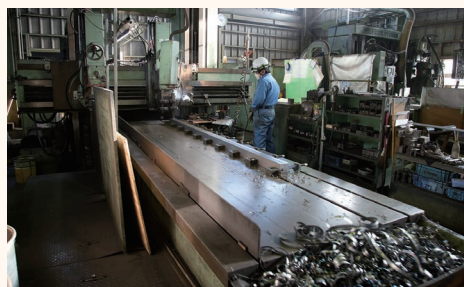
最新のマシニングセンタをはじめ充実した設備を揃えており、さまざまな工程をこなす多能工を目指します。