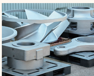
材料を溶解する温度は約1600℃。材料づくりから仕上げまでの一貫生産。