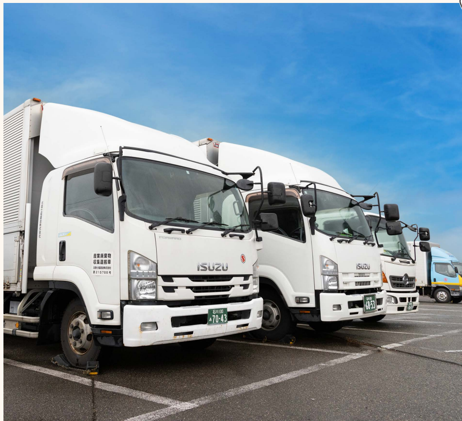
4tトラックが続々と出入りする駐車場。食品を低温で運ぶ保冷車も多数。