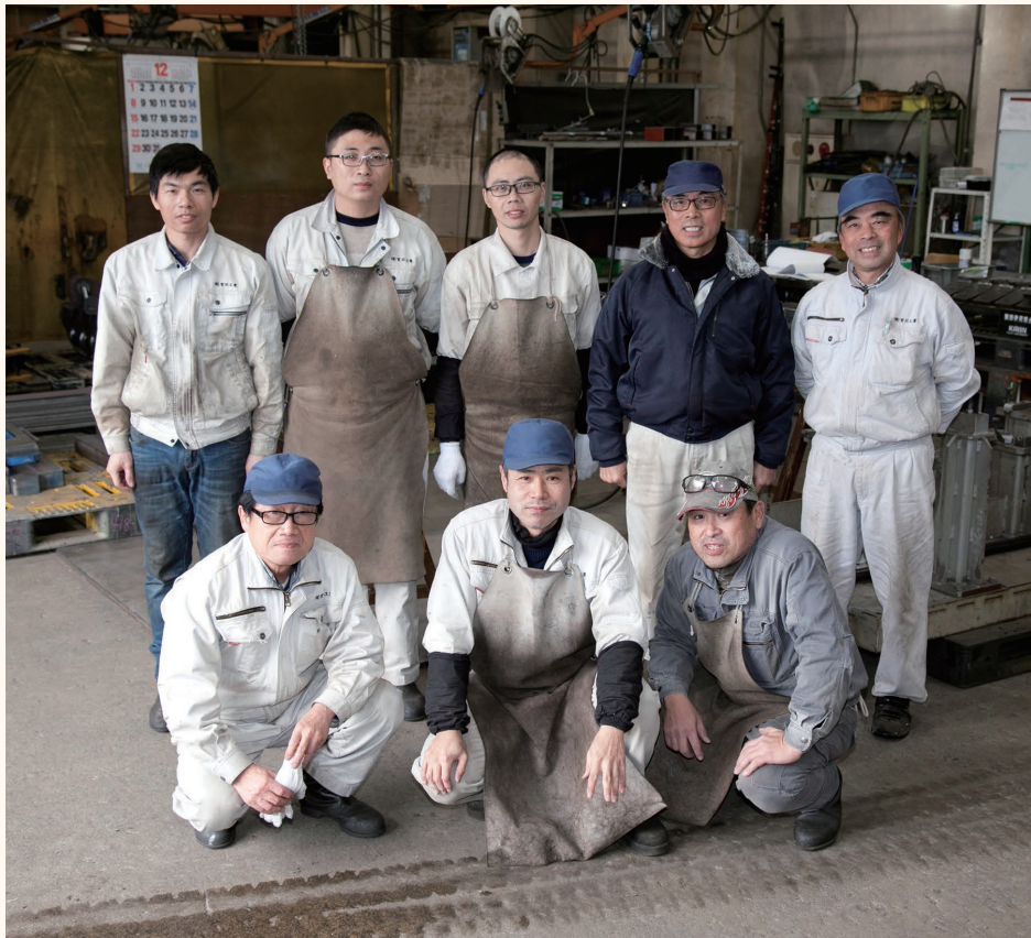
ベテランたちが磨いてきた溶接の技術を受け継ぐ人材を募集中。指導は、マンツーマンで懇切丁寧に。