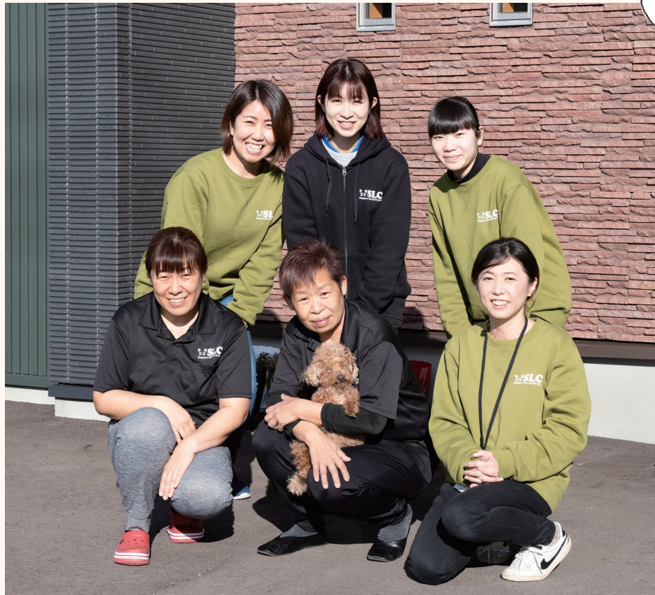
若いスタッフが多い同社。職場はいつも笑い声が絶えません。