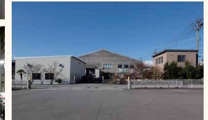
北川鉄工の工場外観。豊富なノウハウとキャリアを武器に、高品質・短納期、高いコスト競争力を少数精鋭で実現しています。工場内には冷房が設置されるなど職場環境の整備も進んでいます。

所属する小松共栄工業協同組合の一員としてエコステージ認証の取得なども推進。環境という視点から効率化や品質改善に取り組んでいます。