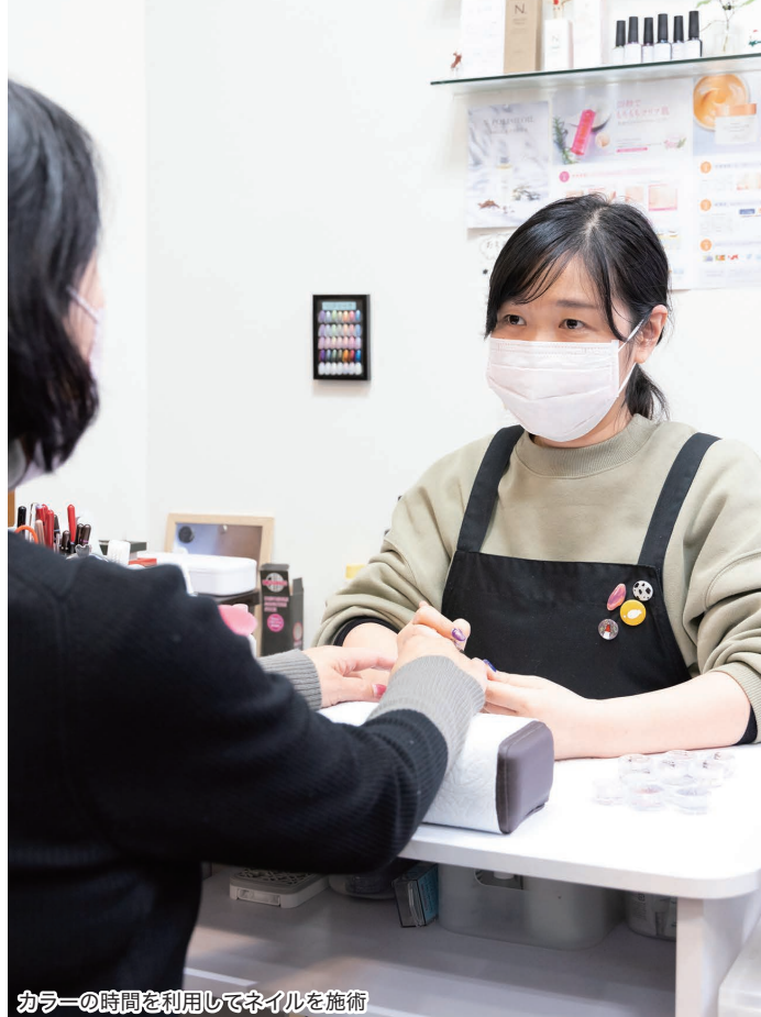
カラーの時間を利用してネイルを施術