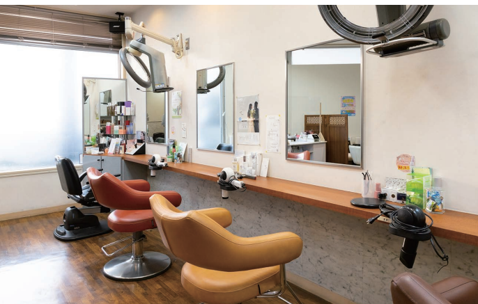
▲やさしいイメージのナチュラルな店内