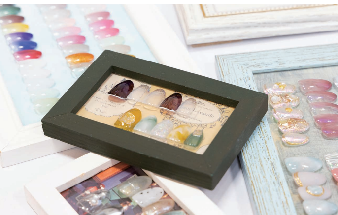
▲爪や髪がきれいになると日常が華やく