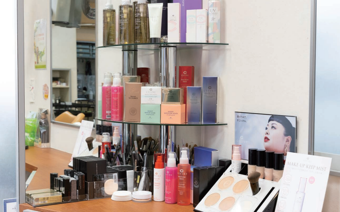
▲今話題の自然派コスメも扱っている