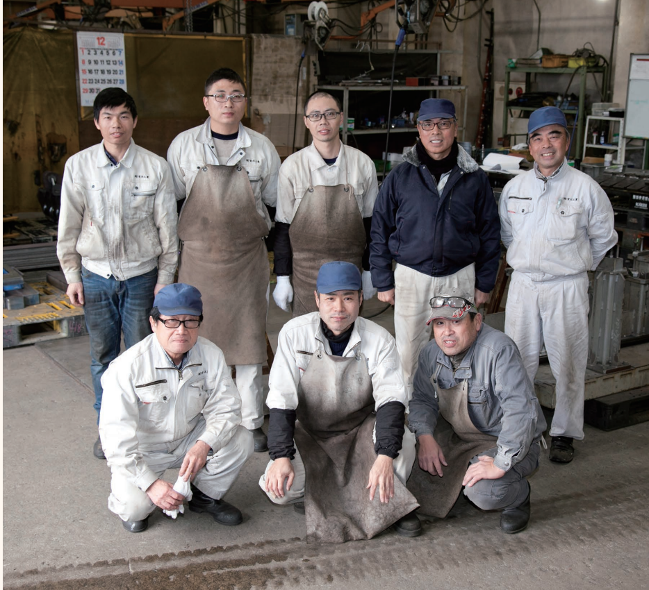
ベテランたちが磨いてきた溶接の技術を受け継ぐ人材を募集中。指導は、マンツーマンで懇切丁寧に。