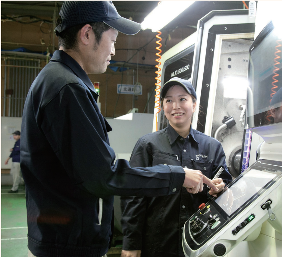
刃具の取付けやプログラム作成などの段取りも重要な仕事。先輩社員が技術や知識を丁寧に教えてくれます。